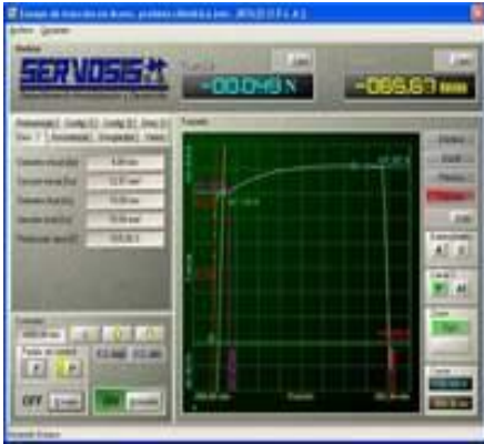
Pantalla de ensayos