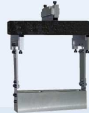
UNE EN 12697-25 METODO B COMPRESIÓN CÍCLICA BAJO CARGA LATERAL